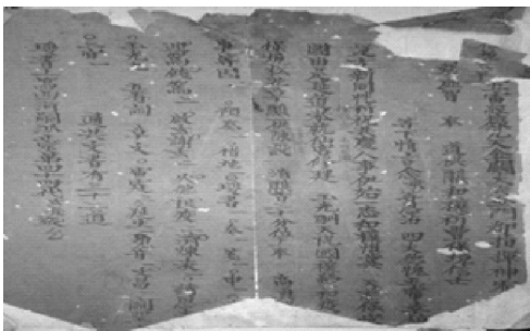
图1 大理巍山岷岷图山张虚智“神霄西河派奏授职牒”（清朝残存版本）