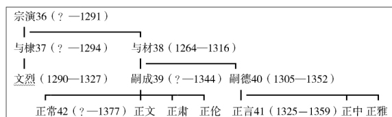
元朝龙虎山张天师的传承世系图

前论当作于元朝的《传天师与弟青词》表明，元朝天师位继承开始盛行兄终弟及制。这与元朝实际的天师位继承情况完全相符。以下是元朝 36 代至 42 代天师的传承世系图：